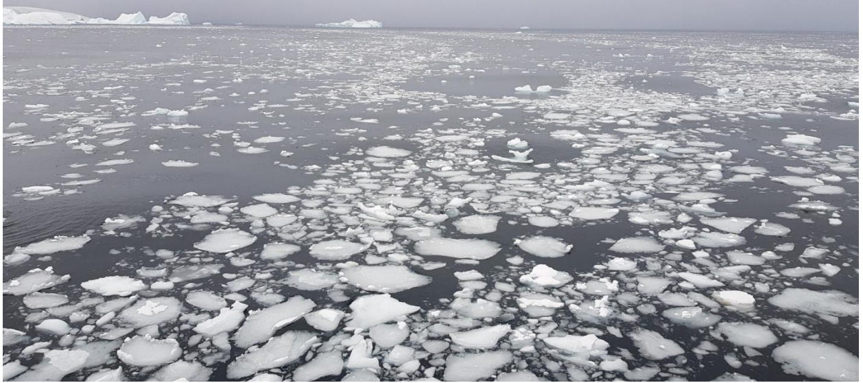
Çalışılan suların genel görünümü (Yeşim Büyükmeriç, Ali Murat Kiliç, 2019)