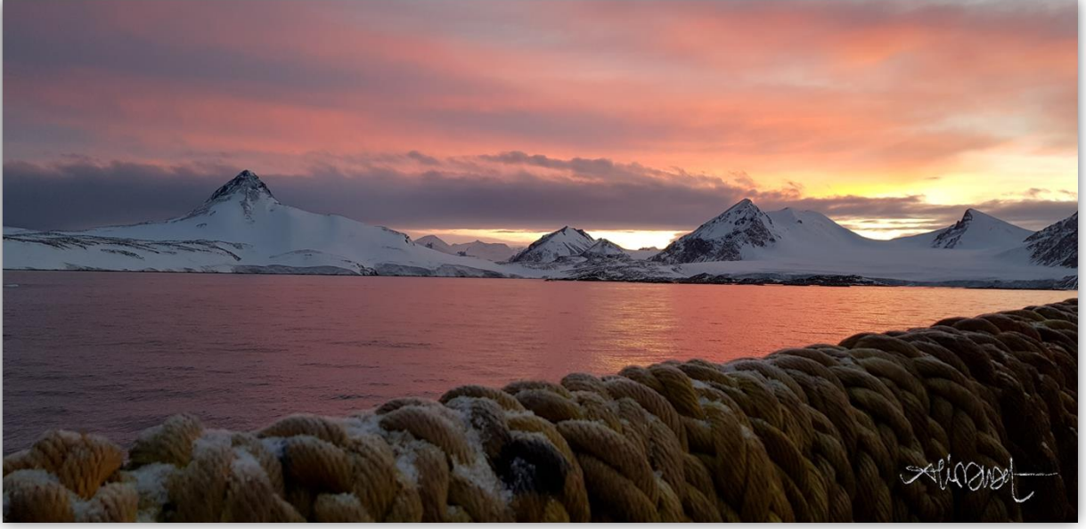
Horseshoe Adasından genel görünüm (Yeşim Büyükmeriç, Ali Murat Kiliç, 2019)